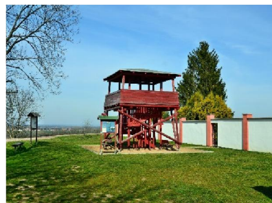
Vyhlídková věž Park Cerhenice