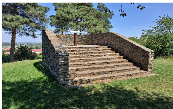
minirozhledna Pičhora u Peček / BONUS /

Práchovna - pozdně gotická kamenná věž zvaná Práchovna byla postavena na břehu Labe v první polovině 15. století jako předsunuté opevnění kolínského hradu. Později sloužila jako skladiště prachu a v současné době funguje jako rozhledna.