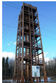
R. na Pol'ane