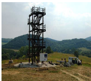
Turá Lúka - Hrajky