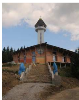
Chrám p. Marie Matky na pout.místě u Turzovky (reál a vizualizace)