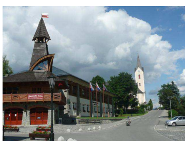
Stará Bystrica rest. s věží