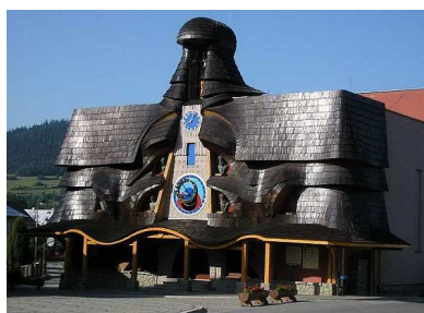
1. SK Orloj ve Staré Bystrici