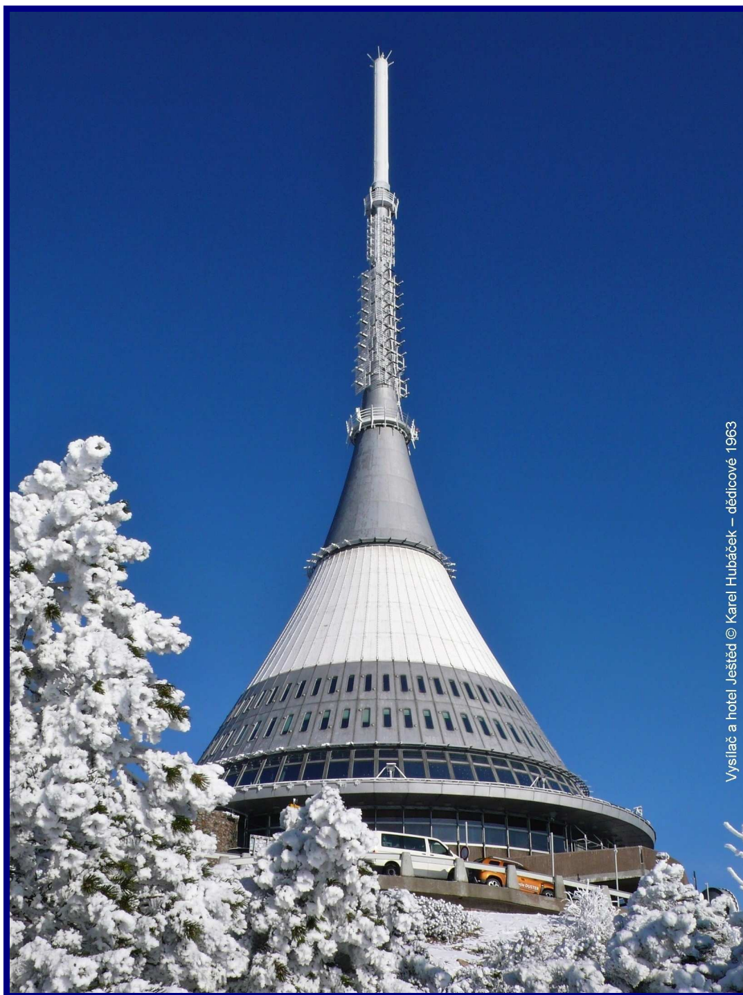
Vysílač a hotel Ještěd © Karel Hubáček – dědicové 1963