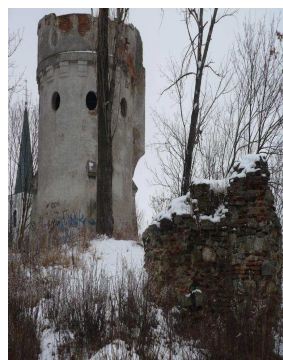
Vodár. V. Bernolákovo