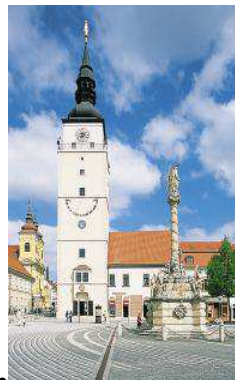
Měst. věž Trnava